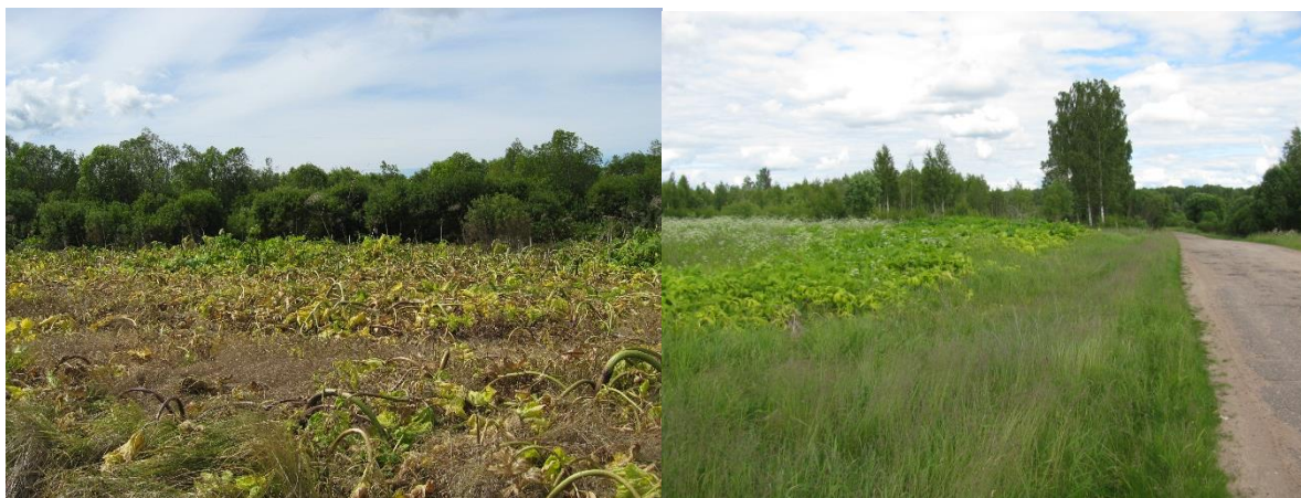
Шимский район, после первой обработки, 2018 год

В придорожных полосах используется гербицид Горгон (ВРК) в смеси с Магнум (ВДГ) и Адью. Горгон (ВРК) обладает избирательным действием, не уничтожает злаковые. В дальнейшем это дает возможность залужения территории. Магнум, ВДГ создает почвенный «экран» и предотвращает прорастание семян в следующем году. ПАВ Адью улучшает проникновение гербицидов в растение. Такая схема показала себя крайне эффективно.