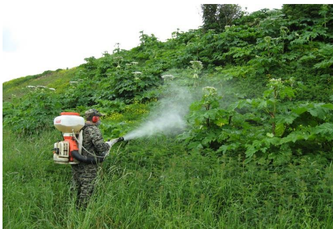
Дер.Егла Боровичский р-н, 2018 год

После обращения в Правительство Новгородской области с просьбой обратить внимание на эту проблему и оказать содействие в ее решении, с 2014 года филиал проводит работы по обработке придорожных полос по госконтрактам с ГОКУ «Новгородавтодор».