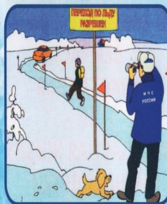
ПОМНИТЕ! Быстрое оказание помощи попавшему в беду возможно только в зоне разрешенного перехода