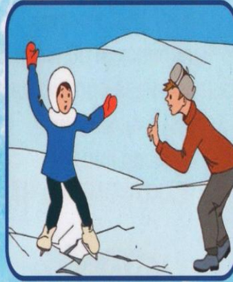
Если под вами затрещал лед и появились трещины не пугайтесь и не бегите от опасности! плавно ложитесь на лед и перекатывайтесь в безопасное место!

ПОМНИТЕ, ЧТО НАШЕ УВАЖЕНИЕ К ВОДНОЙ СТИХИИ СЕЙЧАС, СЧАСТЛИВАЯ И БЕЗОПАСНАЯ ЖИЗНЬ НАШИХ ДЕТЕЙ В БУДУЩЕМ. ПРОСТО ПОГОВОРИТЕ ОБ ЭТОМ С ВАШИМ РЕБЕНКОМ