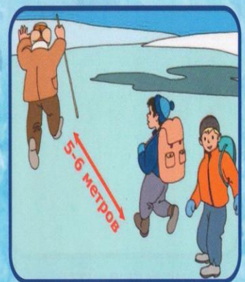
Опасно выходить на лед в одиночку!