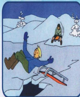
ВНИМАНИЕ! В таких местах под снегом могут быть глубокие трещины и разломы